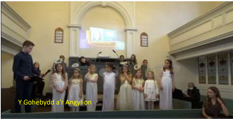
Y Gohebydd a'r Angylion