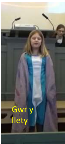
Gwr y llety