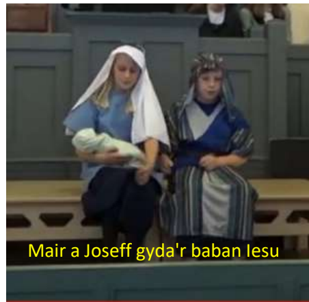
Mair a Joseff gyda'r baban Iesu