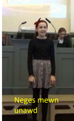
Neges mewn unawd