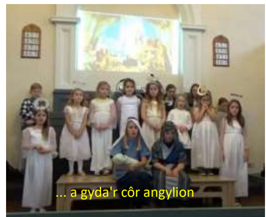
... a gyda'r côr angylion