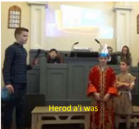
Herod a'i was