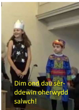
Dim ond dau sêr-ddewin oherwydd salwch!