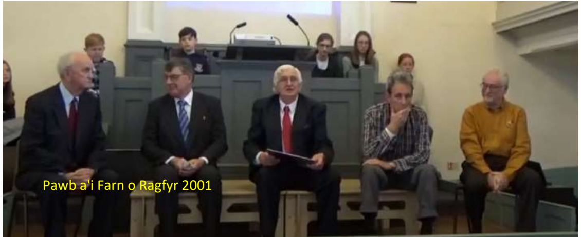
Pawb a'i Farn o Ragfyr 2001