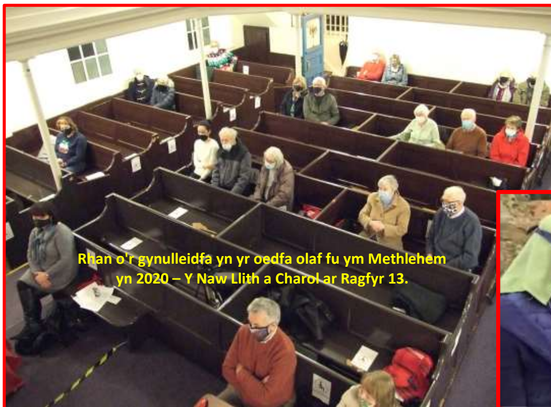
Rhan o'r gynulleidfa yn yr oedfa olaf fu ym Methlehem yn 2020 – Y Naw Llith a Charol ar Ragfyr 13.