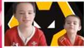
Mabon a Trystan

Buom yn darllen y stori am Mair a Martha yr wythnos hon a roedd y plant wrth ei bodd yn trafod beth oedd nodweddion y ddwy. Fe wnaethon ni sôn am deulu a ffrindiau a pha mor bwysig yw eistedd o gwmpas y ford bwyd i drafod pob math o bethau. Fe wnaethon ni ddweud gweddi fach o ddiolch i'r Iesu ac i ofyn am ei help i fod yn amyneddgar ac ystyriol o bobl eraill.