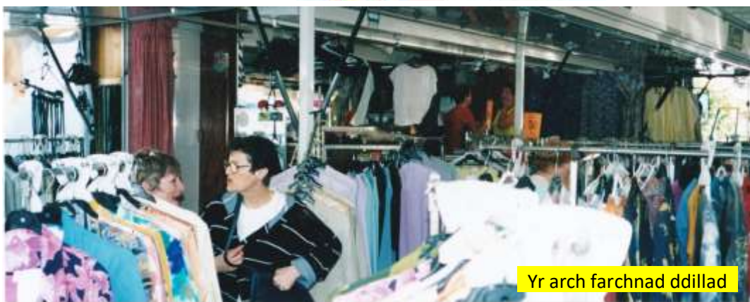
Yr arch farchnad ddillad

Erbyn hyn, roedd y ffatri fach gwneud dillad wedi datblygu'n fusnes llawer mwy ac Helène a'i gŵr yn berchen ar lorïau mawr gydag ystafelloedd newid a tho cynfas anferth yn agor fel adenydd pili-pala ar gyfer gwerthu mewn marchnadoedd. Fe ges innau fentro ar y gwerthu ac ystwytho tipyn ar fy