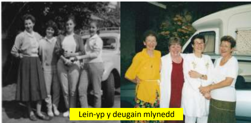
Lein-yp y deugain mlynedd

Yn fy meddiant ers fy ymweliad cyntaf roedd yna lun bach dua gwyn tua dwy fodfedd sgwâr o'r ddwy chwaer, eu mam a minnau o flaen y Renault bach oedd ganddyn nhw. Felly, dyna geisio ail-greu'r olygfa, ddeugain mlynedd yn ddiweddarach.