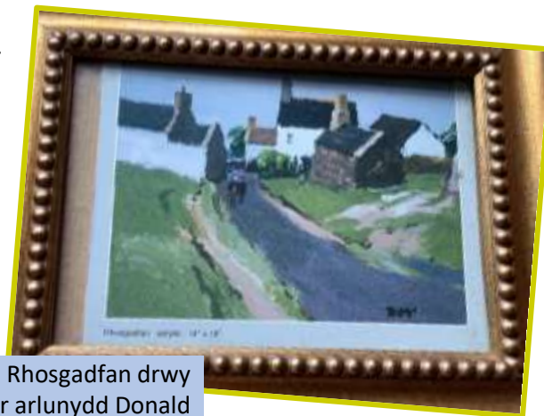
(uchod) Rhosgadfan drwy lygaid yr arlunydd Donald McIntyre

Gwerthwyd y bwthyn ac aethant adre'n ôl. Roedd gadael Rhosgadfan yn brofiad eithaf trist - 'Tell me about it!'