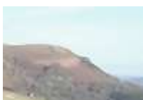
Rhifyn 6 o'r "Gair bach"

Ydy', y mae hi'n glasu. Fe ddaeth eto haul ar fryn (a chawod neu ddwy hefyd!)