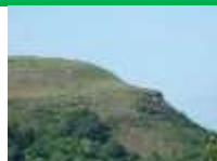
Rhifyn 12 o'r "Gair bach"