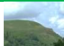
Rhifyn 13 (heddiw) o'r "Gair bach"