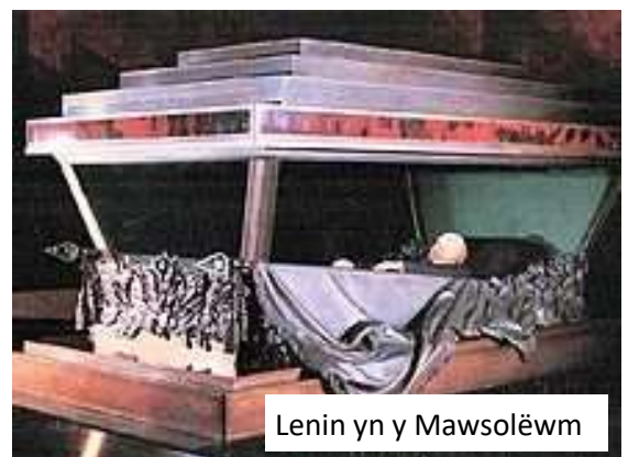
Lenin yn y Mawsolëwm